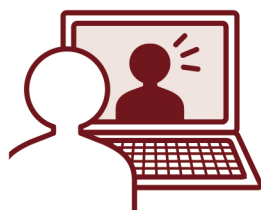
オンラインで 打合せ出来ます